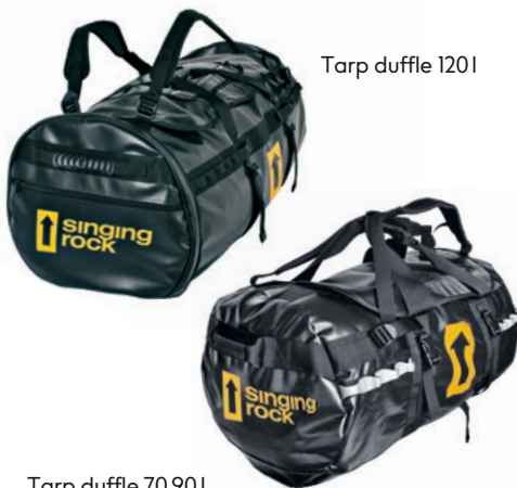
Tarp duffle 120 l

70 litros – C0046BB70 90 litros – C0046BB90 120 litros – C0046B120