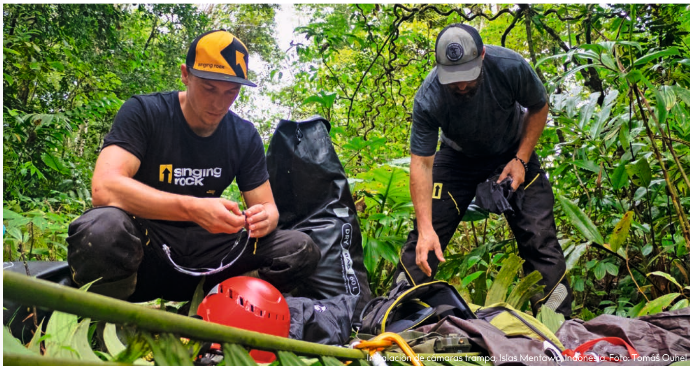
Instalación de cámaras trampa, Islas Mentawai, Indonesia.

Hilo de Kevlar • Tallas: 8, 9, 10; 11 EN 388, EN 420